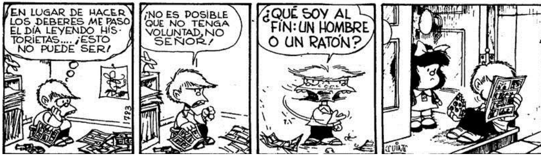
Viñeta de Joaquín Salvador Lavado, Quino. #MafaldaQuotes