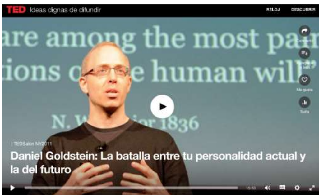
Pincha en la imagen para ver el video.